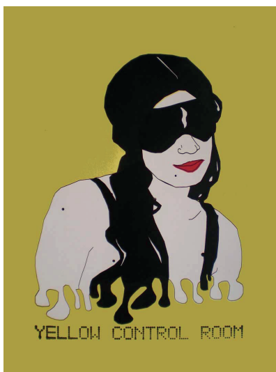
Yellow control room n°1 Sérigraphie 50x70 cm 50 euros