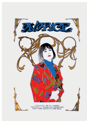
Avarice Sérigraphie 50x70 cm 50 euros