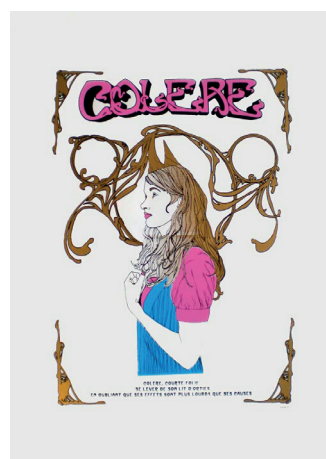
Colère Sérigraphie 50x70 cm 50 euros