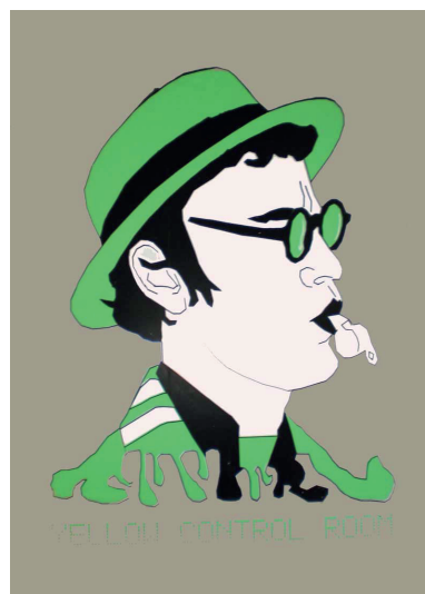
Yellow control room n°2 Sérigraphie 50x70 cm 50 euros