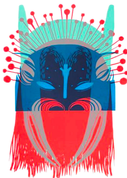
Dyptique ToTem n°100 et ToTem n°122