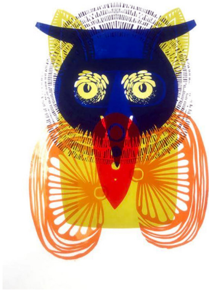
ToTem n°8 Sérigraphie 60 x 42 cm 30 euros