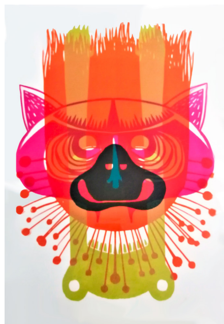
Dyptique ToTem n°41 et ToTem n°170