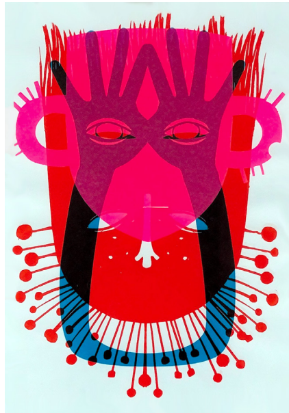
ToTem n°83 Sérigraphie 42 x 30 cm 15 euros