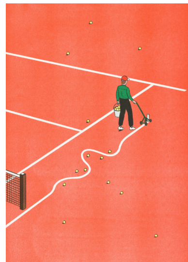
Roland-Garros Risographie 29,7 x 42 cm