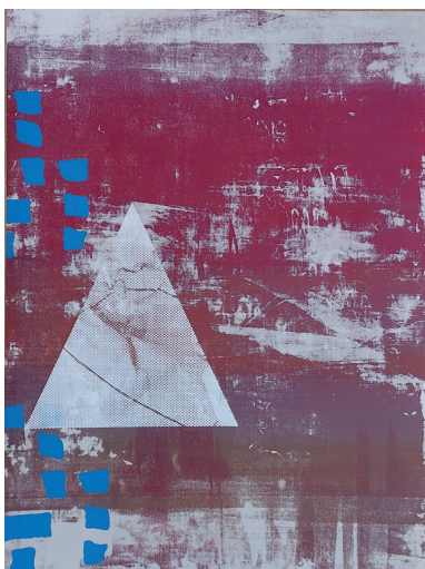
Partition Graphique 1 Sérigraphie 55 x 74 cm 200 euros