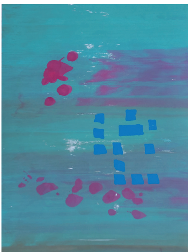
Partition Graphique 3 Sérigraphie 55 x 74 cm 200 euros