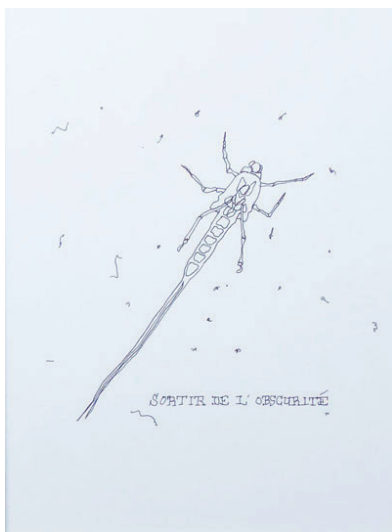
Sortir de l'obscurité Dessin sur papier 21 x 29.7 cm 240 euros