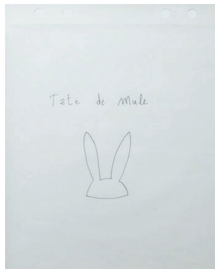
Tête de mule Dessin sur papier 21 x 29.7 cm 240 euros