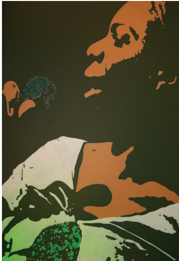
Nina Simone Sérigraphie sur papier 80 x 54 cm 500 euros