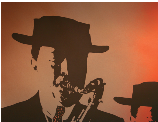
Lester Young (rouge) Sérigraphie sur papier 57 x 67 cm 300 euros