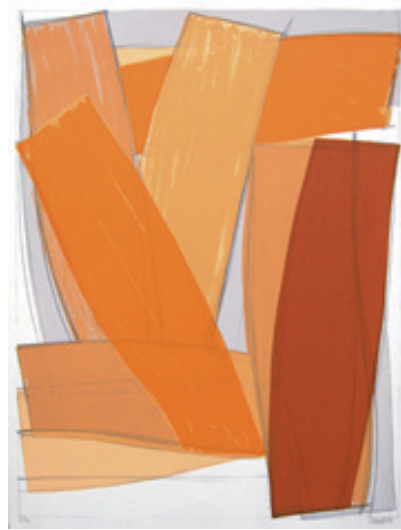
Sans titre orange Sérigraphie 3/30 67 x 87 cm 450 euros