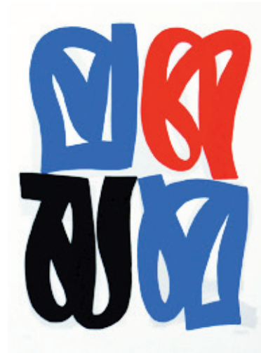
Sans titre 2 Sérigraphie 3/30 67 x 87 cm 450 euros