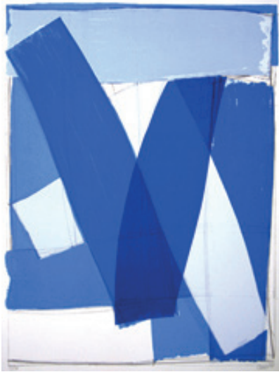
Sans titre bleu Sérigraphie 3/30 67 x 87 cm 450 euros