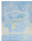
Marion Bernard , Atalante , 1/14

Le corps, et plus particulièrement la figure de l'athlète, constitue dès l'Antiquité un sujet de prédilection pour les artistes. En effet, dans la Grèce antique, la supériorité physique est directement liée à la perfection de l'esprit. Encore aujourd'hui, le culte du corps athlétique demeure au centre des préoccupations de nos sociétés contemporaines. Les productions, abstraites ou figuratives, rassemblées dans cette thématique présentent une multitude de corps, idéalisés et réalistes, en mouvement. Il se dégage de ces représentations corporelles en action, qu'elles soient décomposées, disproportionnées, distinctes ou bien mêlées les unes aux autres, une sensation de rythme, de vitesse, de force, voire parfois même de fragilité et de douceur.