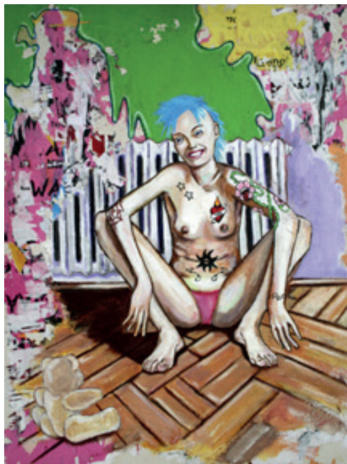
Punky Girl Acrylique sur toile 80x60 cm 800 euros