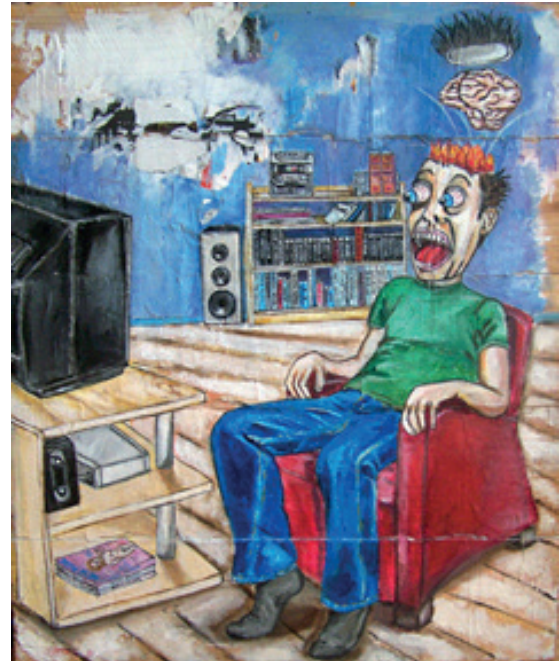
Devant la TV Technique mixte sur bois 71x59,5 cm 500 euros