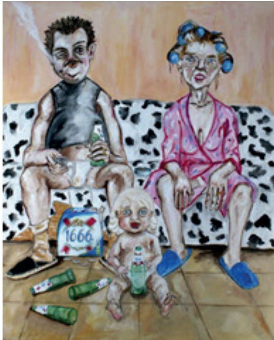
La famille Acrylique sur toile 100x80 cm 1 000 euros