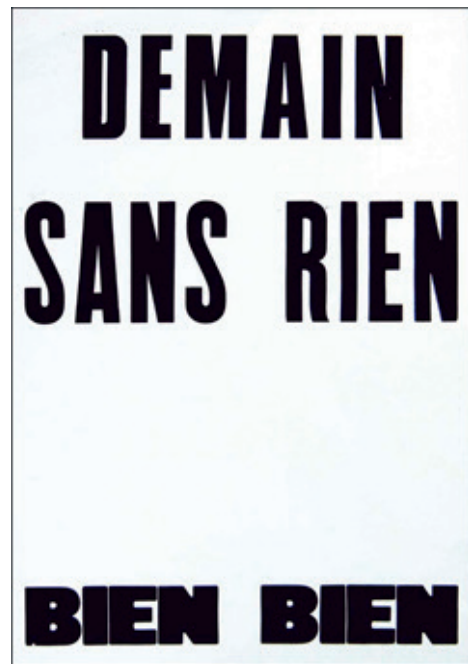
Demain bien bien Impression au tampon 100x70 cm 300 euros