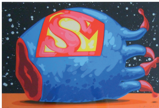
Superman Sériographie 57 x 77 cm 250 euros