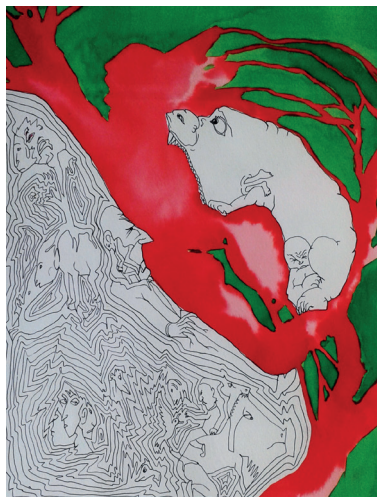
Sans titre 3 Encre sur papier 50 x 40 cm 800 euros