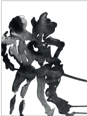
Sans titre 1 Encre sur papier 50 x 40 cm 800 euros