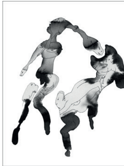
Sans titre 2 Encre sur papier 50 x 40 cm 800 euros