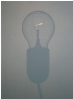
Ampoule Tirage numérique plastifié sur PVC 40,5 x 29,5 cm 300 euros