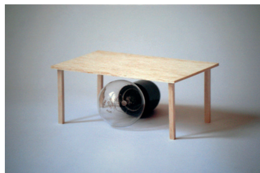
Sans titre Tirage numérique plastifié sur PVC 26,5 x 40 cm 300 euros