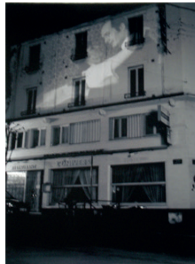
L'éducation sentimentale Tirage numérique plastifié sur PVC 40,5 x 29,5 cm 300 euros