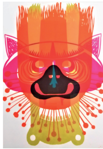
ToTem n°170 Sérigraphie 42 x 30 cm 15 euros