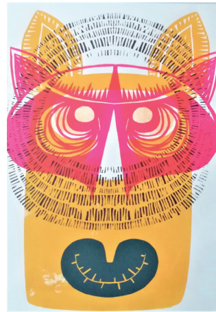
ToTem n°52 Sérigraphie 42 x 30 cm 15 euros