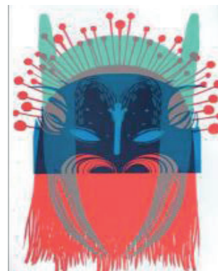
ToTem n°122 Sérigraphie 42 x 30 cm 15 euros