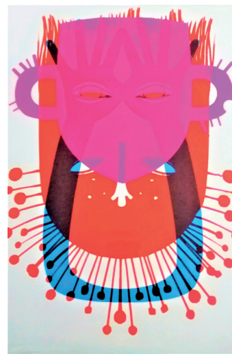
ToTem n°83 Sérigraphie 42 x 30 cm 15 euros