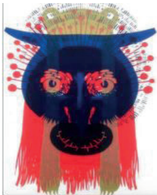
ToTem n°100 Sérigraphie 42 x 30 cm 15 euros