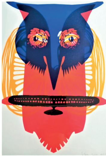
ToTem n°41 Sérigraphie 42 x 30 cm 15 euros