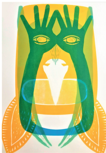
ToTem n°82 Sérigraphie 42 x 30 cm 15 euros