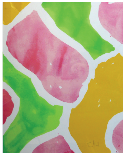
Haricot Rouge Sérigraphie 70 x 50 350 €