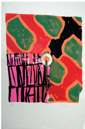
Bâche empiecement Sérigraphie 63 x 90 700 €