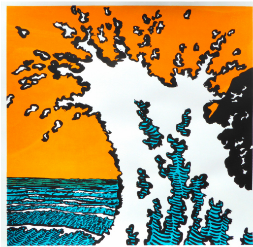
Vague 2 Sérigraphie 55 x 50 cm