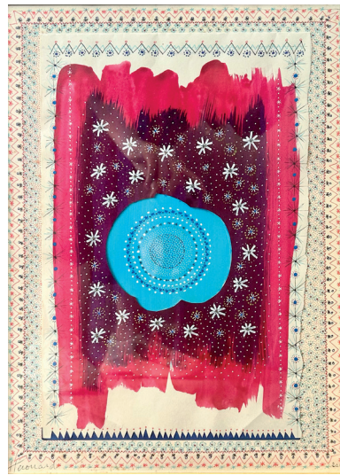
Désir d'ailleurs irrépressible papiers découpés, encres, lavis acryliques 40 x 30 cm 400 euros