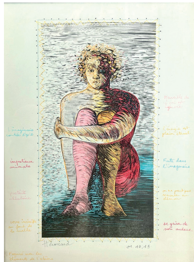
Oedipe Gravure sur bois 43,5 x 33,5 cm 300 €