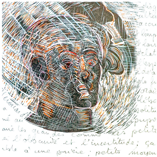
N'avoir que les étoiles pour se diriger Acrylique et encre de chine 27 x 33 cm 300 euros