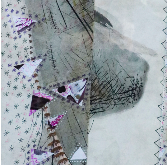
Morceaux choisis Acrylique et encre de chine 23 x 33 cm 300 euros