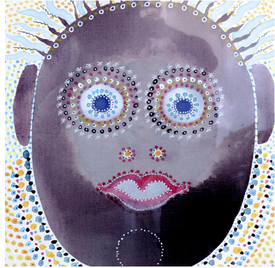
On l'appelle la marmite Acrylique sur toile 33 x 43 cm 400 euros