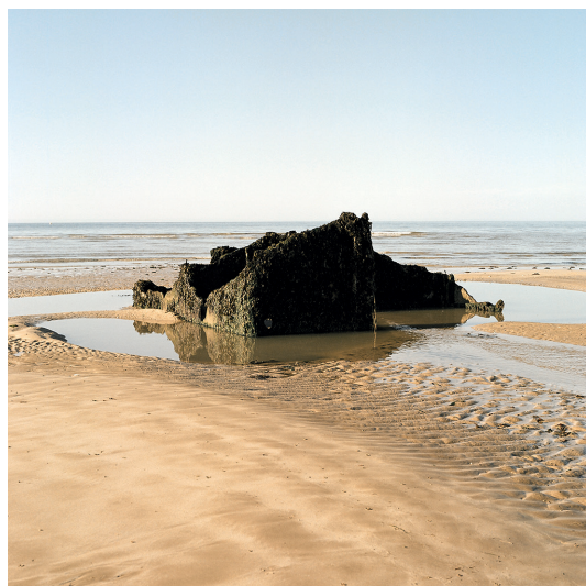
Ver-sur-mer Photographie 30x30cm 50x50cm avec cadre 247 euros