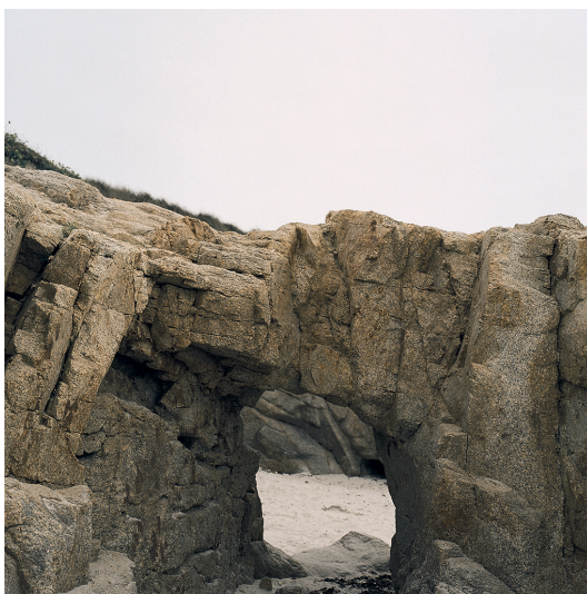
Plouarzel Photographie 30x30cm 50x50cm avec cadre 247 euros