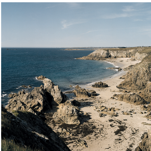
Corsen Photographie 30x30cm 50x50cm avec cadre 247 euros