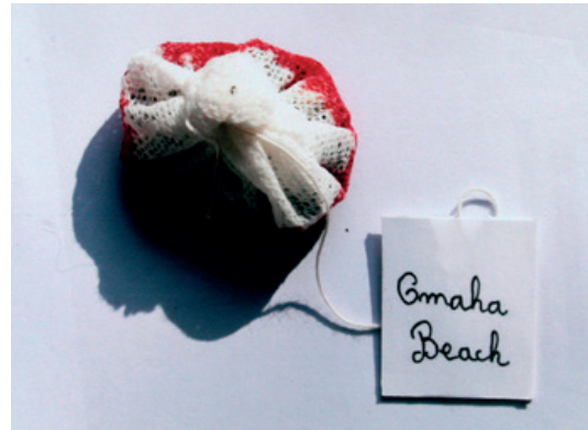
Omaha Beach Photographie 30 x 40 cm