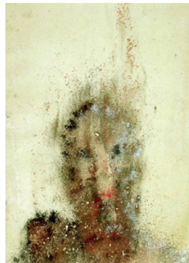
Sans titre (beige) Pastels sur papier 33.7 x 29 cm 500 euros