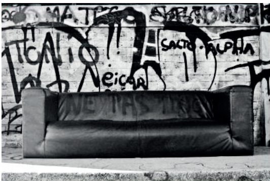
Ne pas toucher photographie numérique 30 x 45 cm 280 euros