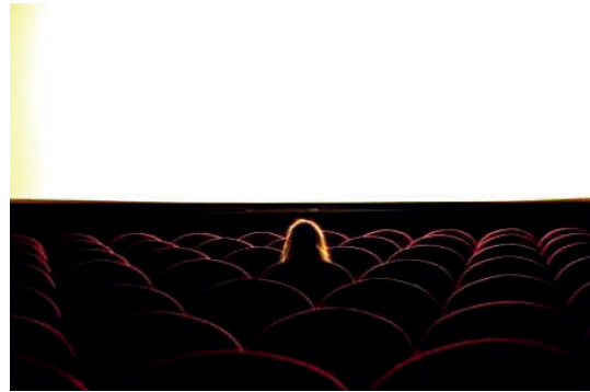
Dernière séance photographie numérique 30 x 45 cm 280 euros