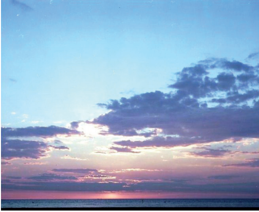
Trouville (ciel) photographie numérique 60 x 70 cm 500 euros