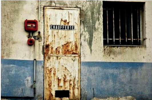
Chaufferie photographie numérique 30 x 45 cm 280 euros