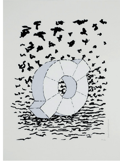
Sculpture 2 Sérigraphie 56 x 75 cm