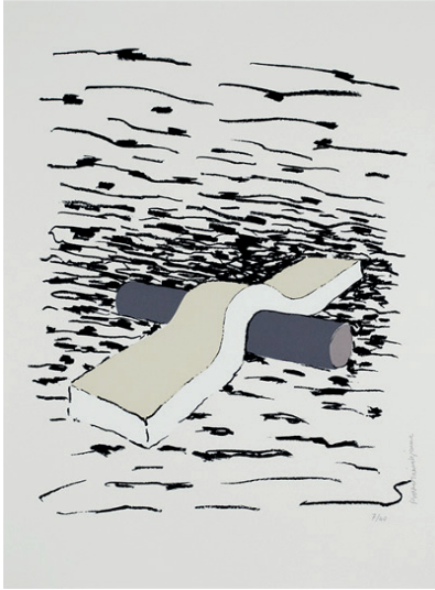
Sculpture 1 Sérigraphie 56 x 75 cm