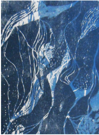
Ombre portée I Gravure 30 x 40 cm 120 €