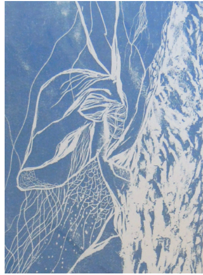
Ombre portée II Gravure 30 x 40 cm 120 €