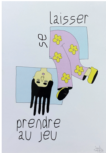
Se laisser prendre au jeu Tirage numérique, 2022 32,7x45 cm Indisponible à la vente