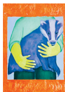
Cléopée Barazer , Le Blaireau

Marion Bernard, diplômée de l'École supérieure d'arts et médias de Caen (ésam), pratique l'illustration et l'estampe. Dans ce travail de gravure délicat, représentant un paysage forestier et montagnard, l'artiste excelle dans l'illusion du proche et du lointain. Celle-ci est, en effet, donnée à voir par la fine transition du noir au blanc ainsi que par la netteté des traits, s'estompant du premier à l'arrière-plan.